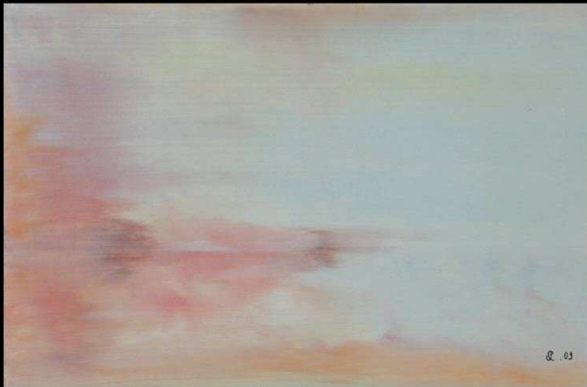
Abstrait 19 Huile sur Toile 54 x 81