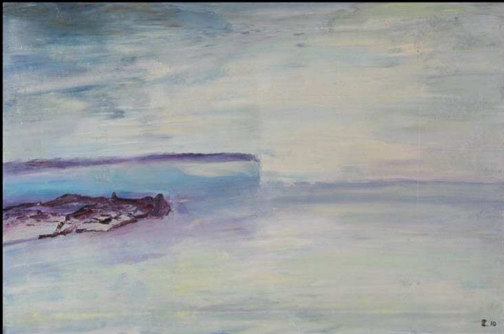
Abstrait 16 Huile sur Toile 60 x 80