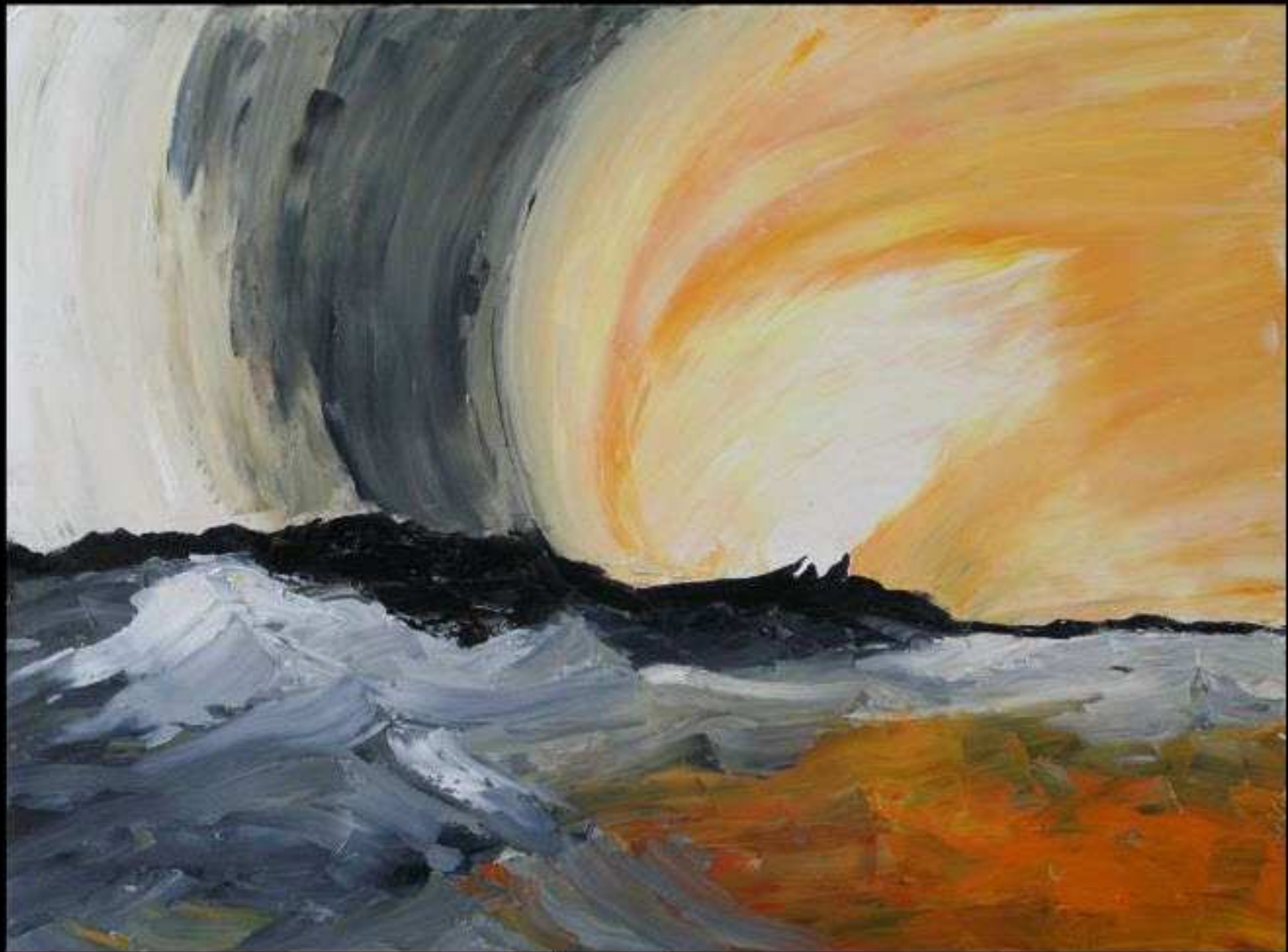
Abstrait 25 Huile sur Toile 60 x 81