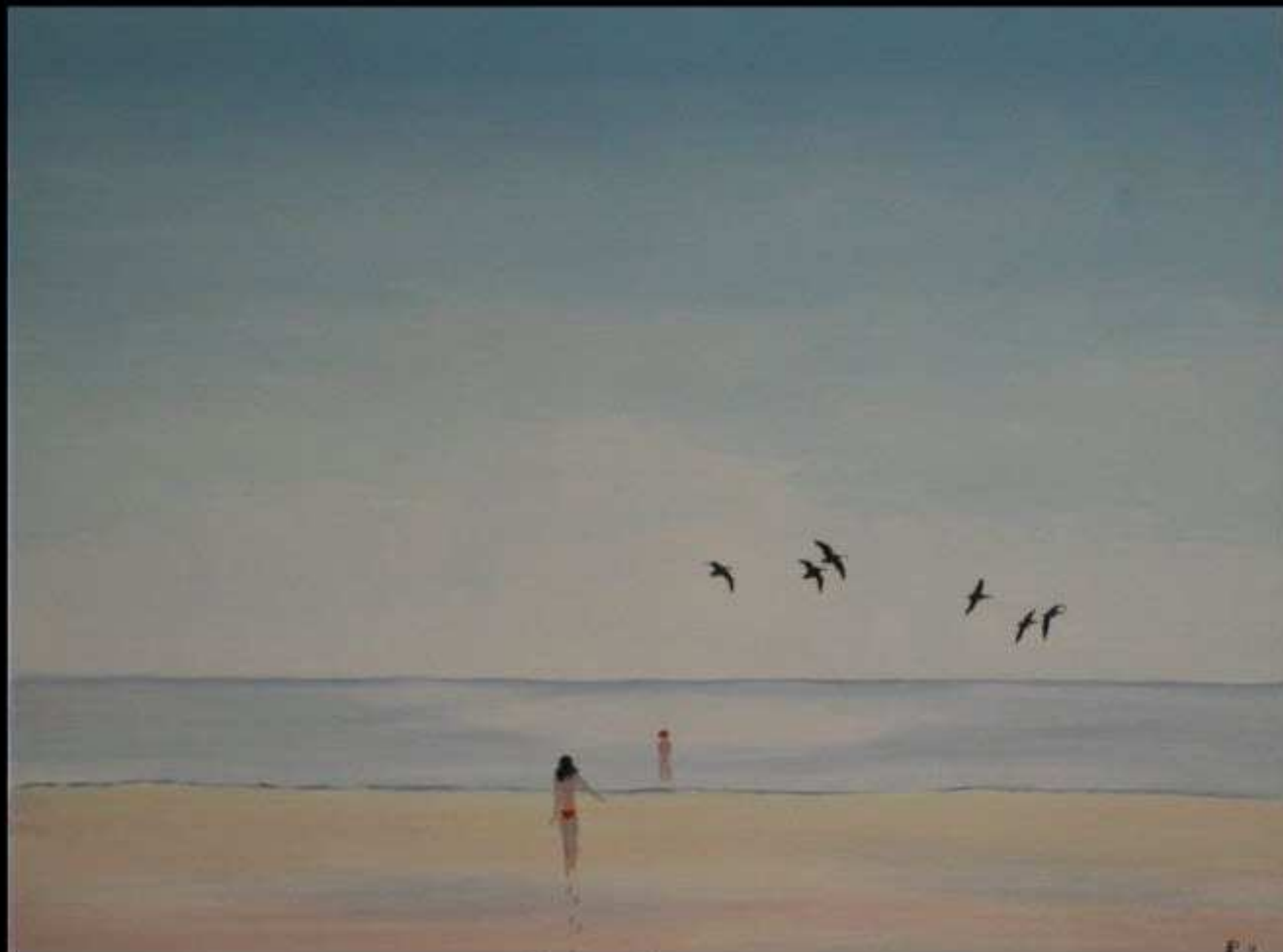
Débordement Huile sur Toile 81 x 100