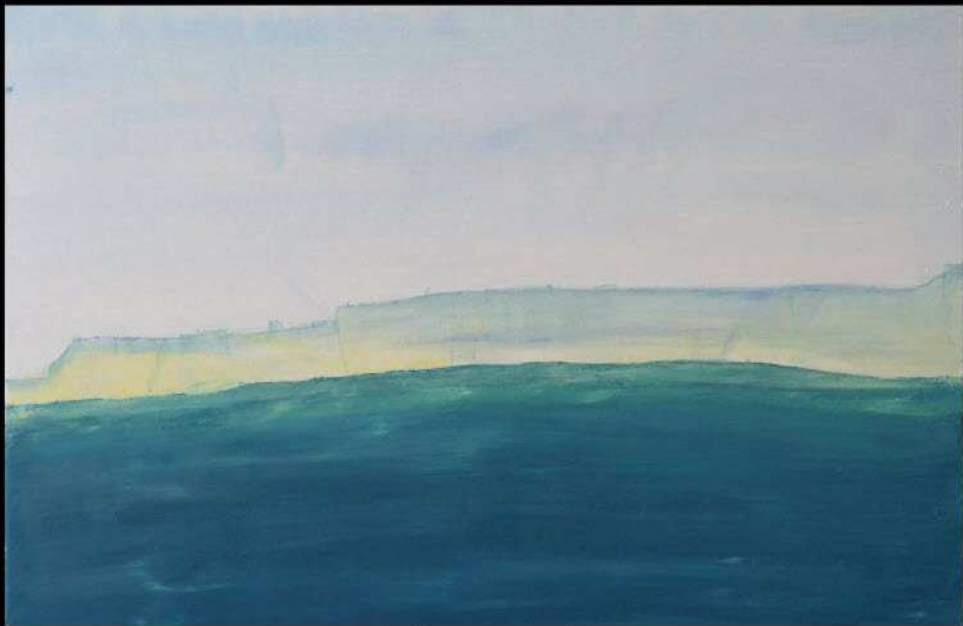
Abstrait 20 Huile sur Toile 54 x 81